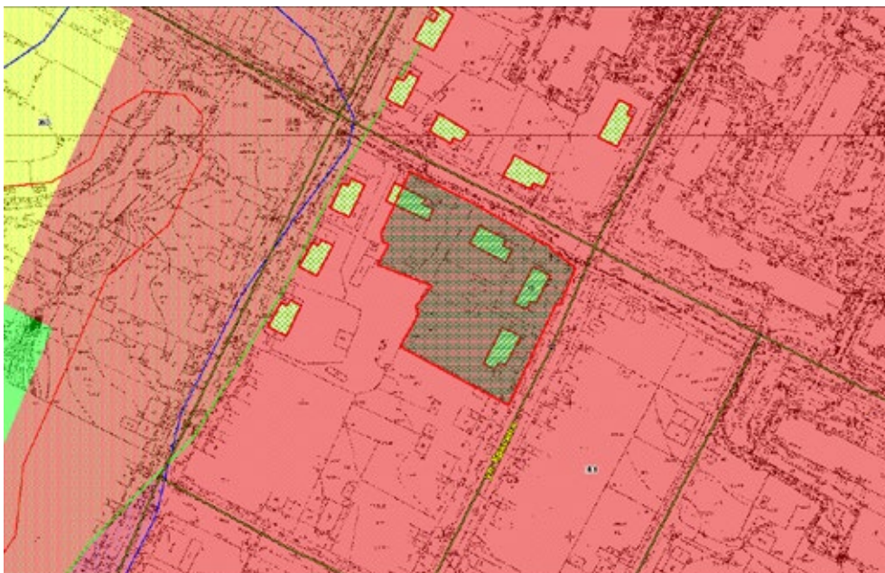
Схема территории, подлежащей развитию

ориентировочная площадь территории, подлежащей развитию — 3570 м 2